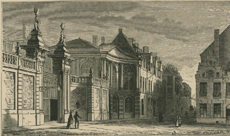
L'HÔTEL D'ARENBERG. ENTRÉE DE LA RUE AUX LAINES. Dessin de Victor De Doncker.

Le Salon de 1839 fut une étape encore, annonça un progrès, apporta des œuvres qui attestèrent pour l'école belge une notable force de production, des études sérieuses, un labeur ininterrompu.